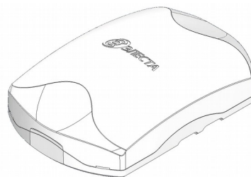
Рисунок 1. Внешний вид прибора

Прибор изготовлен в пластмассовом корпусе (рисунок 1).