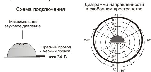
Рис.2 Схема подключения и диаграмма направленности звука оповещателя.

5.3. На рис.2 показана схема подключения и диаграмма направленности звука.